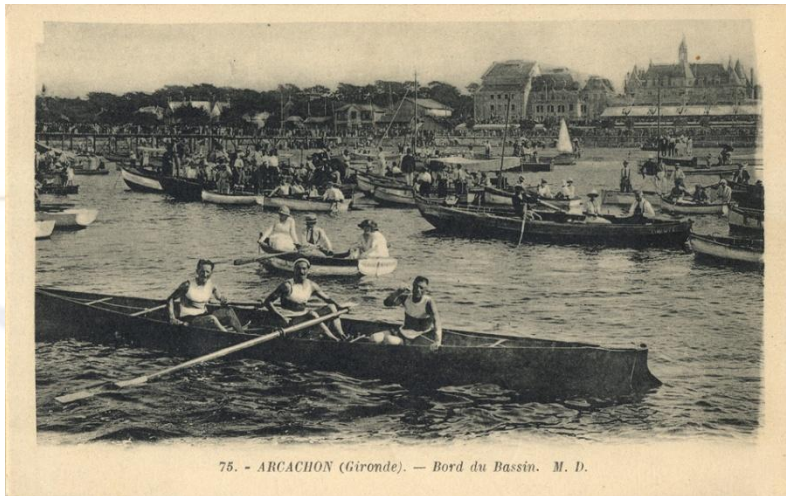
75. - ARCAÇON (Gironde). — Bord du Bassin. M. D.

Richesses paysagère et culturelle Patrimoine culturel Activités touristiques