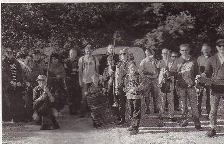
Une partie des participants qui a œuvré à rendre à la nature, samedi 17 mai, un visage plus propre.

Samedi 17 mai, la mairie organisait une matinée de ramassage des débris à laquelle se sont associés la Ceba et l'Espace-jeunes.