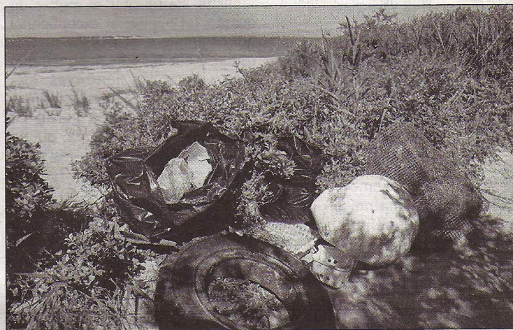
« Ces déchets n'ont rien à faire là, deux passages ont été nécessaires à cause du manque de scrupule d'une minorité. »